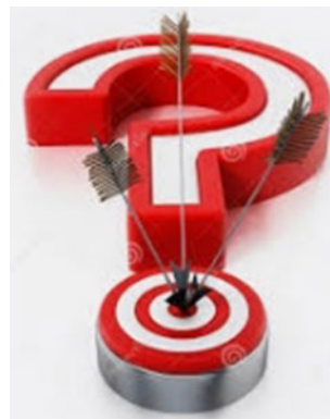
Version ? Quand ?

Il nous faudra attendre vraisem- blablement la version V5 qui sera présentée par la direction environ six mois avant le départ pour Sa- clay.