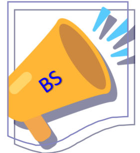
Le Porte Voix de BS

21/01/20 : Réunion extraordinaire CSE (Le PV sera accessible sur H:\Commun BS\Vie du centre\Comptes-rendus CE après approbation en séance plénière du mois de Février)